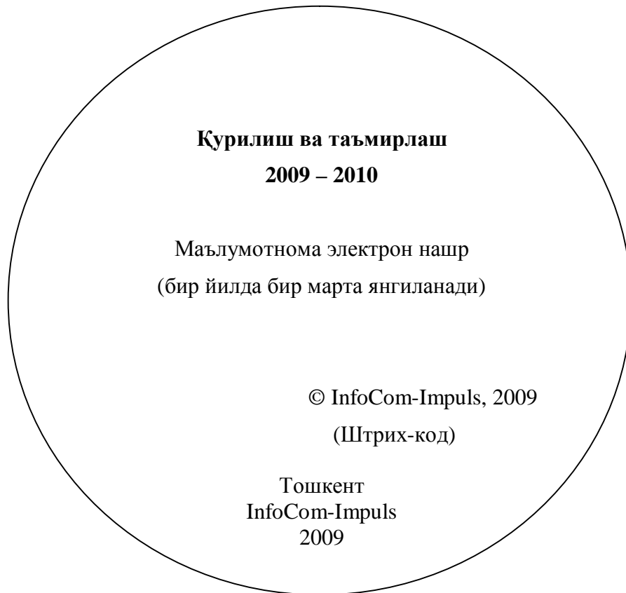
А.6.2–расм. Элтувчи ёрлиғи

Маълумотнома битта электрон элтувчида етказиб берилади ва локал ҳамда тармоқ режимларида фойдаланилиши мумкин. Тизим локал ҳисоблаш тармоғидаги серверлардан бирига ўрнатилганда, унга бир неча фойдаланувчининг бир вақтда кириши таъминланади.